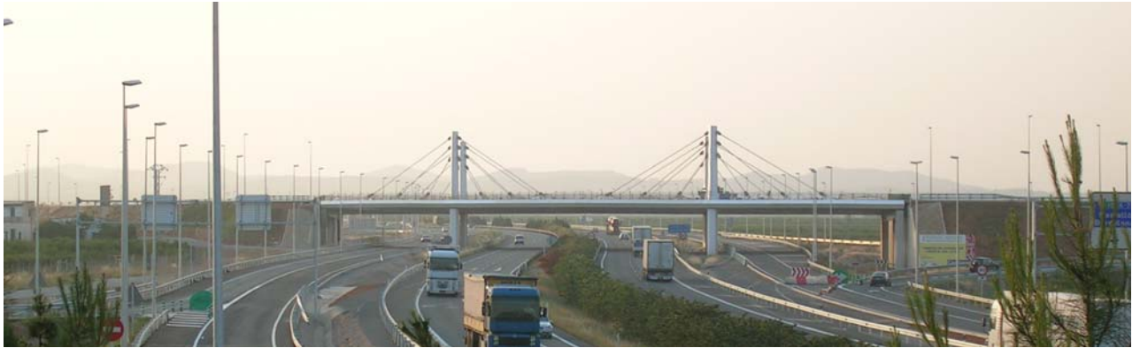
Foto 1. Vista general del Viaducto sobre el By-Pass

Los cables del sistema de atirantamiento, con diámetro exterior variable entre 225 y 245 mm., están formado por cordones paralelos y son de longitud prefijada y terminados en mazarotas de conexión.