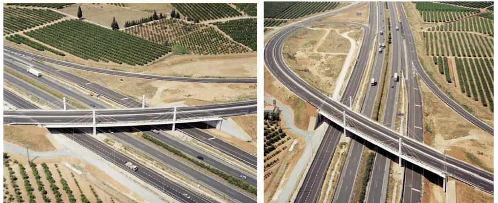
Figuras 7 y 8. Vistas aéreas de la estructura terminada.

Funcionalmente, el viaducto ejecutado alberga dos calzadas, una de 7.00 m y otra de 4.00 m de ancho, arcenes laterales de 2.50 m y mediana central de 3.00 m.