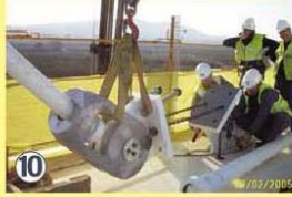
Tesado de cables y retirada del apeo provisional central.