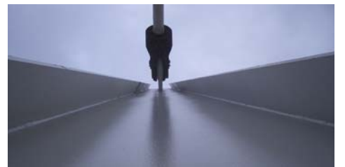
Figura 2. Detalles de anclaje