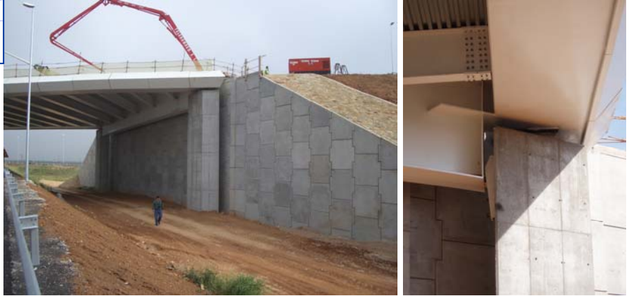
Figuras 5 y 6 . Alzado de estribo 2 y detalle de ménsula antilevantamiento

En la zona de estribos, el tablero se apoya, a través de apoyos tipo POT, en dos pilastras prismáticas de hormigón armado cimentadas sobre dos pilotes de 1.00 m pilotes, situadas por delante de los paramentos de suelo reforzado del estribo, independizando de esta forma la estructura principal del comportamiento deformacional del macizo de suelo reforzado que constituyen los estribos.