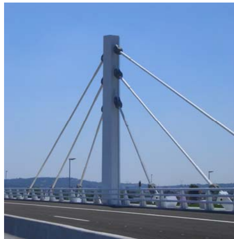
Figura 4. Alzado pilono

Los pilonos, de 12.0 m altura y sección hexagonal, son mixtos con chapa exterior de 20 mm. y relleno de hormigón y están empotrados en el tablero en su unión con las vigas longitudinales y transversales. Bajo la unión del tablero con los pilonos se han colocados aparatos de neopreno que transmiten las cargas a las pilas de hormigón armado con forro formal metálico. Estas pilas, también con sección hexagonal, tiene una altura en le entorno de los 8.00 m y está cimentada sobre encepados que recogen cinco pilotes de 1.00 m de diámetro.