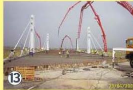
Hormigonado de la losa superior.